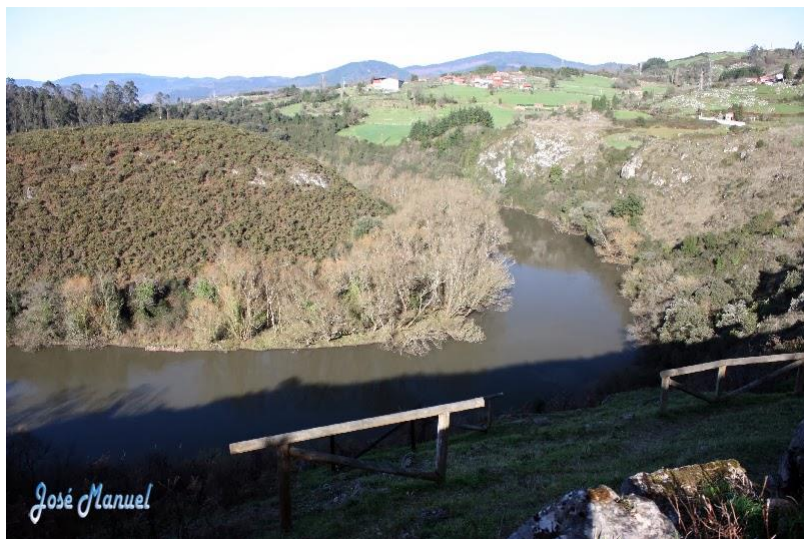
Meandros del Nora

Volvemos a la carretera y vamos hasta nuestro próximo destino que es el pueblo de Tahoces.