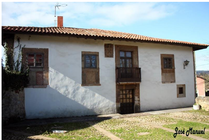
Palacio de Valsera