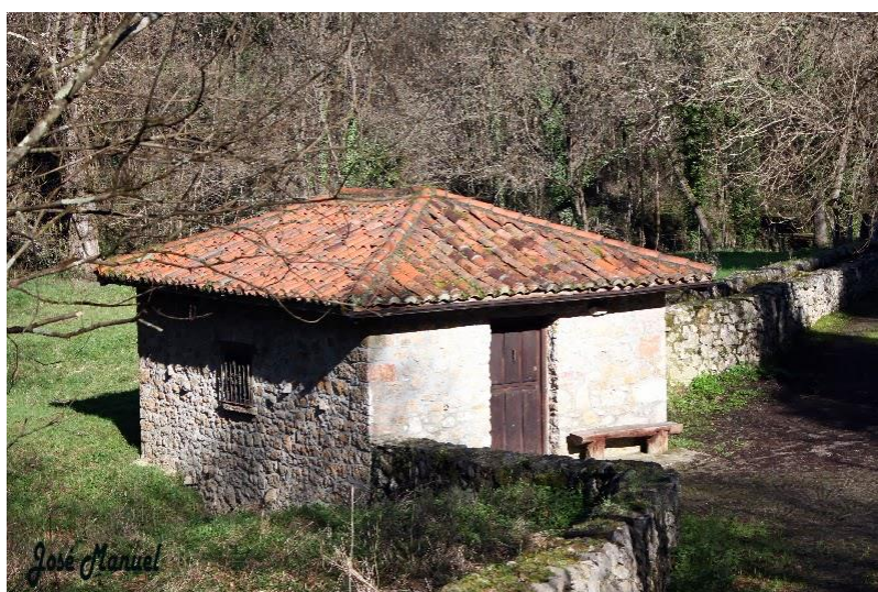
Molino de Picarín

Una vez visitado el molino, volvemos al camino principal que, con ligera subida, nos encamina al lugar de La Rabaza.