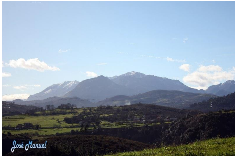
Cordillera El Aramo