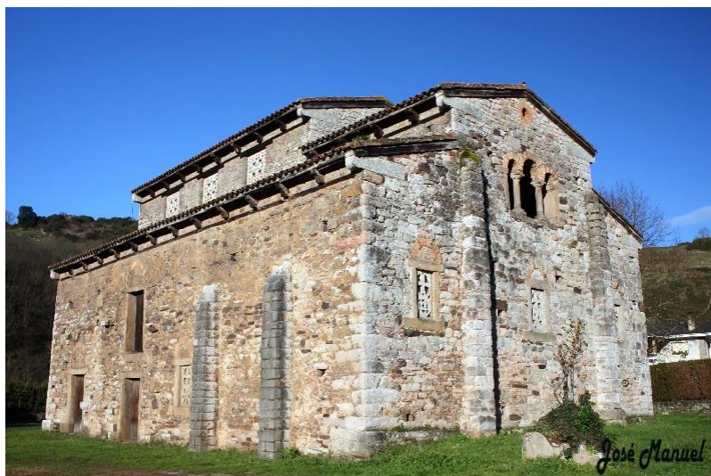
Iglesia prerrománica de San Pedro de Nora