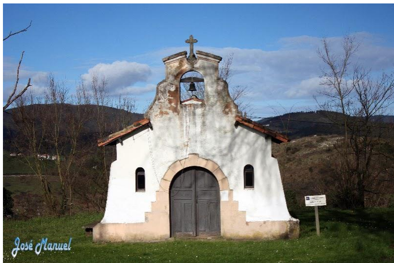
Capilla de Fátima

A la salida de Valsera, un camino señalizado a la derecha, nos lleva casi a la entrada de Escamplero.