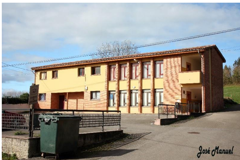
Albergue de peregrinos de Escamplero

A los pocos metros de pasar el indicador de Escamplero, tenemos que girar a la derecha hacia el albergue de peregrinos.