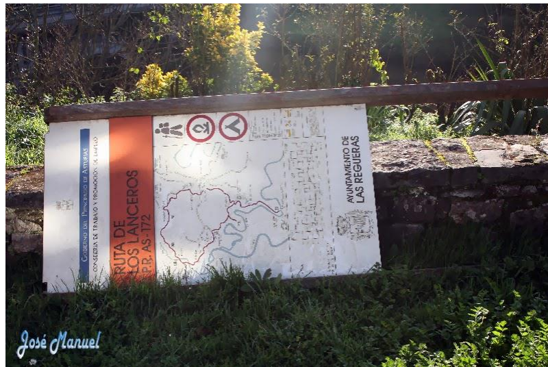
Panel de la ruta tirado

Comenzamos a andar cruzando el pueblo en toda su longitud y continuar por la carretera durante un kilómetro.